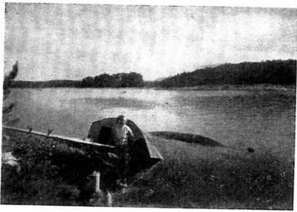
Ämbarsundin vehmaisella rannalla.

21. ihanan auringonlaskun aikaan, vedettiin High Life maihin Ämbarsundissa viheriöivään lahteen, jossa ruohomatto ulottui vesirajaan asti, se riisuttiin varusteista ja sai paneutua levolle mehevään ruohikkoon. Telta pystytettiin ja miehistö valmisti ihanan ja tuiki tarpeellisen myöhäisen päivällisen.